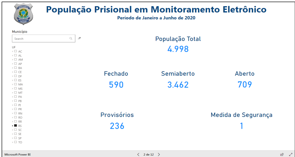
Figura 3 — População prisional em monitoramento eletrônico